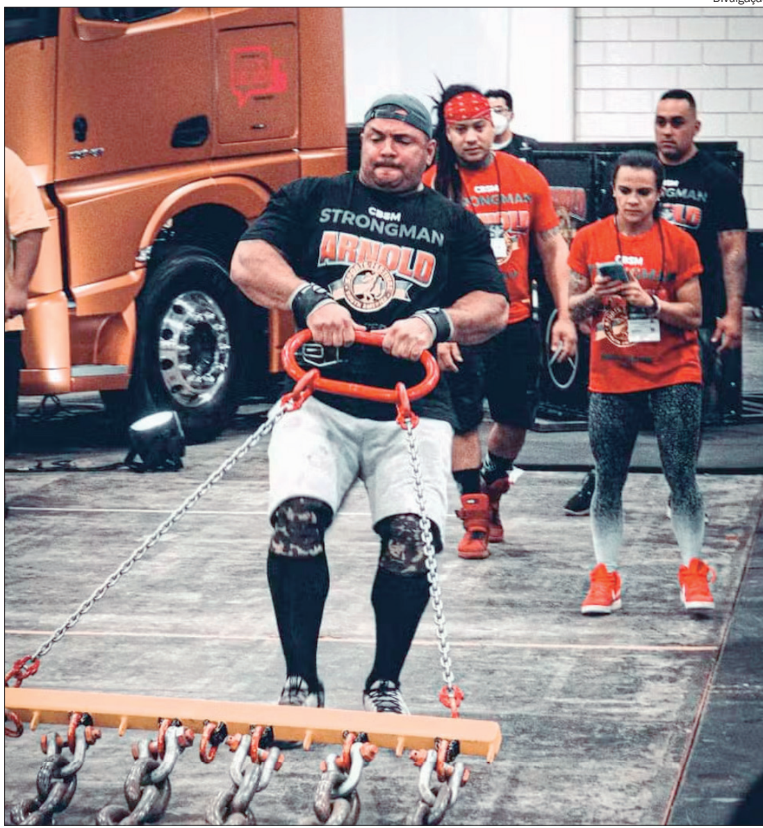
Pela primeira vez no Centro-Oeste, torneio reunirá atletas de quatro países da América do Sul

Os ingressos são gratuitos, limitados e podem ser garantidos pelo site.