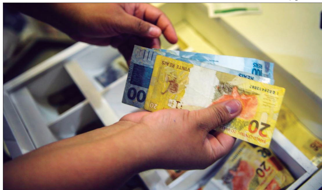
Projeção de expansão da economia está em 3,05% este ano, diz relatório do Banco Central

Quando a taxa Selic é reduzida, a tendência é que o crédito fique mais barato, com incentivo à produção e ao consumo, reduzindo o controle sobre a inflação e estimulando a atividade econômica.