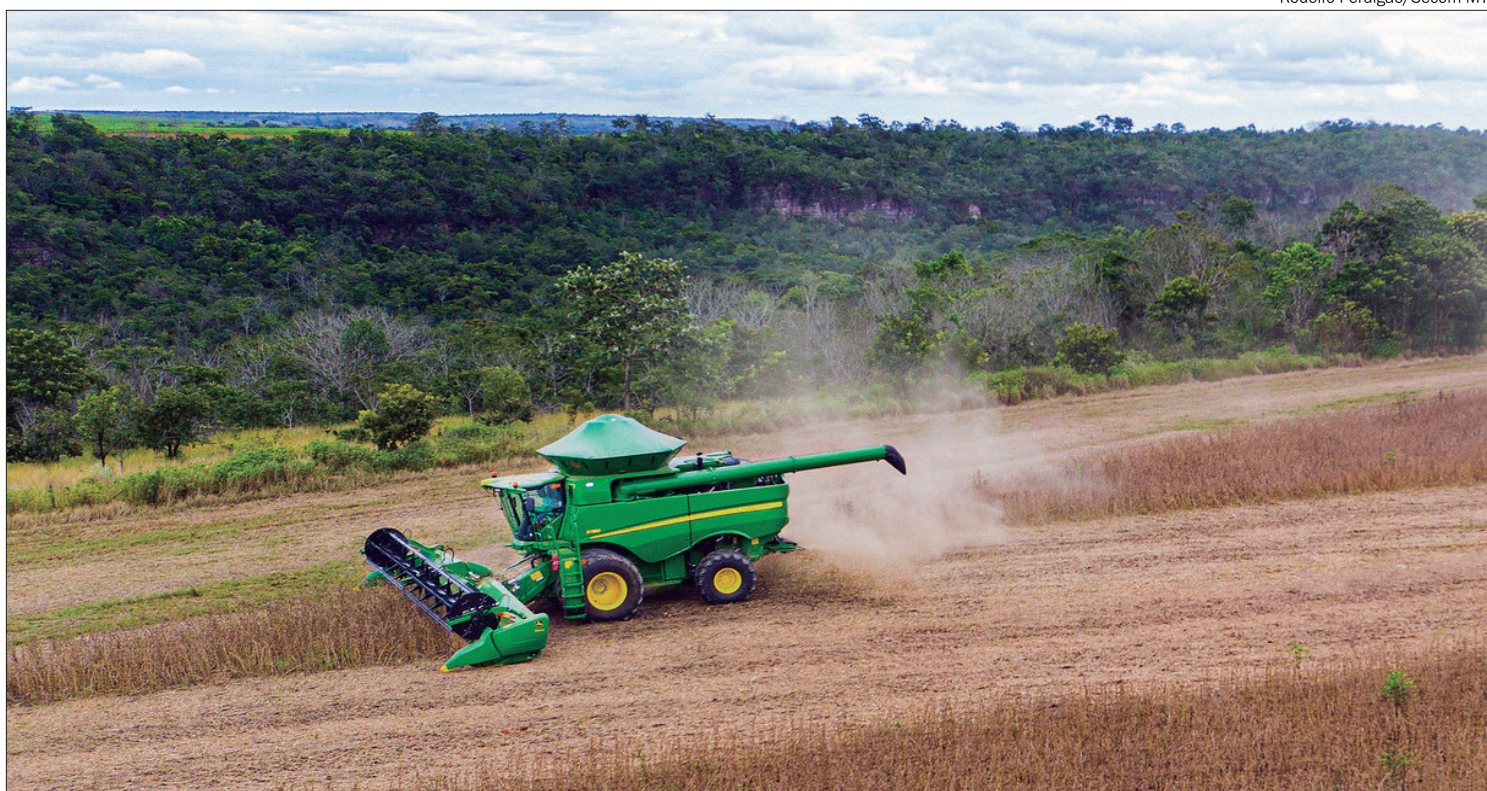
Sorriso, localizado na região norte de Mato Grosso, foi o município mais produtivo do Brasil

DIVERSIDADE DE PRODUÇÃO - Além das principais culturas como soja, milho e algodão, o levantamento do Ministério da Agricultura evidenciou a diversidade da produção agrícola brasileira, incluindo culturas como café, laranja e arroz. O Rio Grande do Sul, por exemplo, lidera na produção de arroz, com