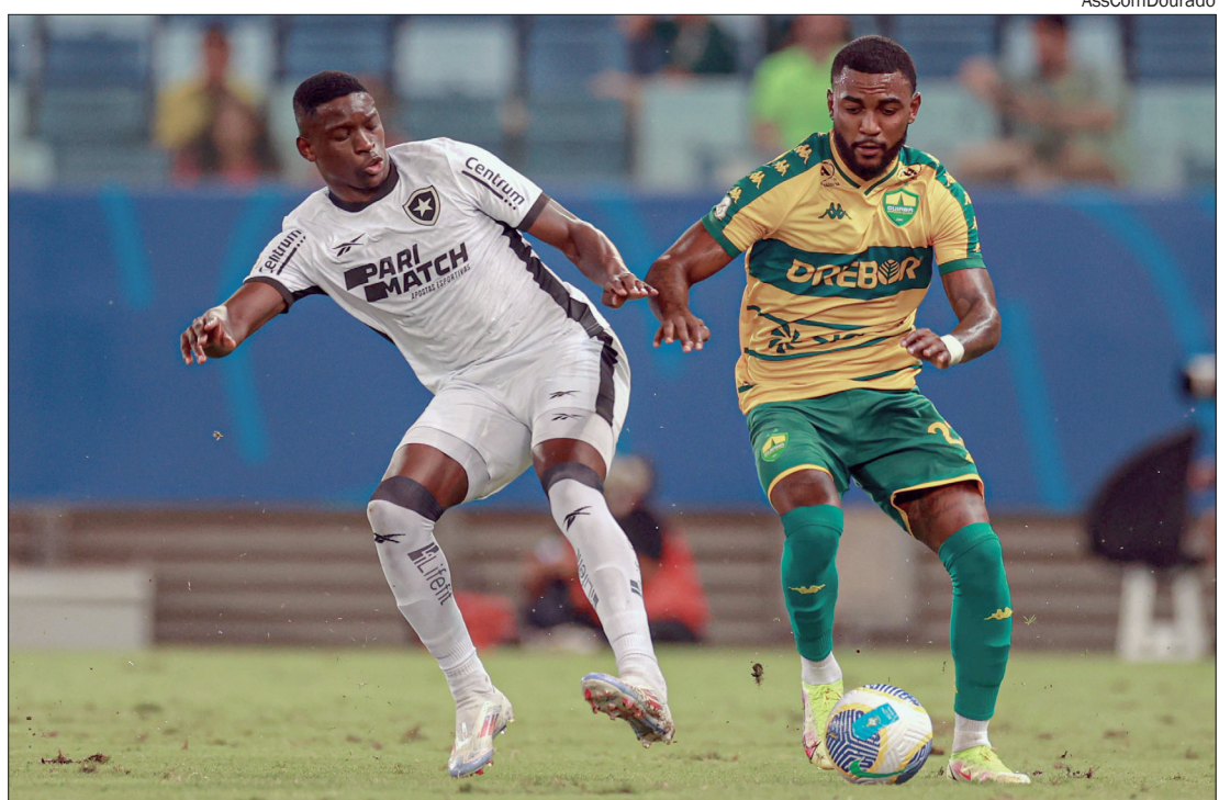
O Cuiabá perde uma posição, é o 15º e está cada vez mais próximo do Z4. São 13 pontos em 14 jogos

O Cuiabá se mantém determinado a retornar às vitórias e se afastar da zona de rebaixamento, onde atualmente ocupa a 15ª colocação com 13 pontos.