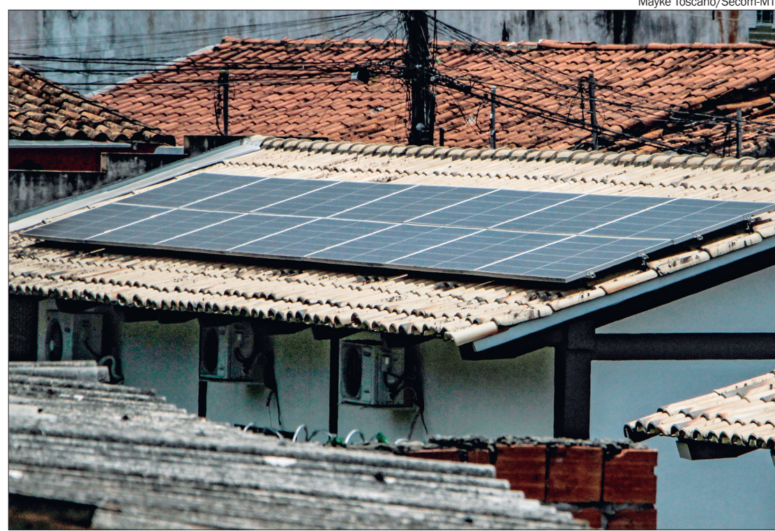
O estado possui mais de 133 mil conexões operacionais de energia solar em telhados e pequenos terrenos, espalhadas em Mato Grosso

"O sol que tanto castigou o nosso povo agora representa um tempo de mudanças e oportunidades para o Brasil, seja para a renovabilidade das nossas matrizes, ou para a construção de transições energéticas justas e inclusivas, gerando energias limpas, emprego e renda para nossa população", destacou o ministro de Minas e Energia, Alexandre Silveira.