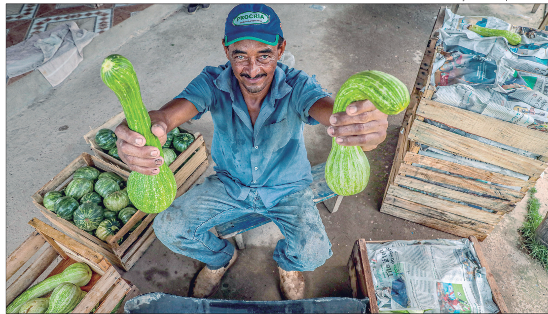
O Plano Safra da Agricultura Familiar tem ainda taxas que variam de 0,5% a 6%, com redução para duas linhas de financiamento

O Pronaf Mais Alimentos ganhou uma sublinha de financiamento, com redução de 5% para 2,5% para compra de máquinas de pequeno porte. Também nessa linha, tiveram redução de 4% para 3% as atividades de aquisição e instalação de estruturas de cultivo protegido, inclusive equipamen-