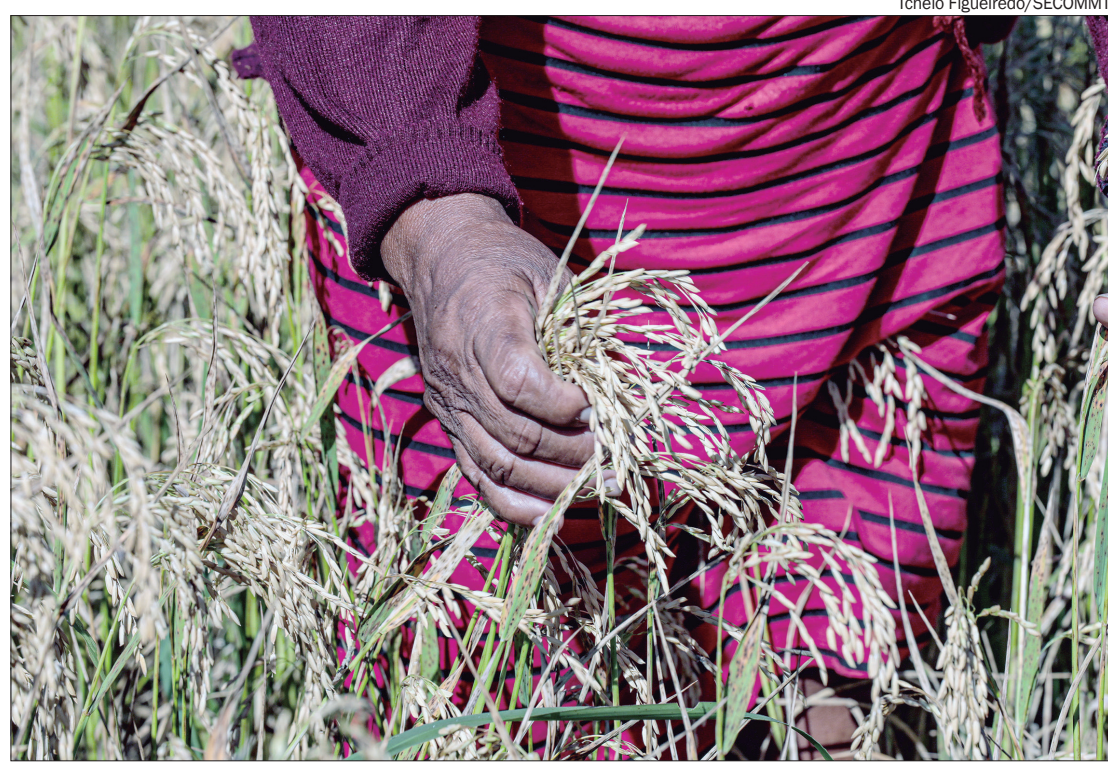
Para o ministro Carlos Fávaro, o cancelamento do pregão serviu para "dar um freio de arrumação"