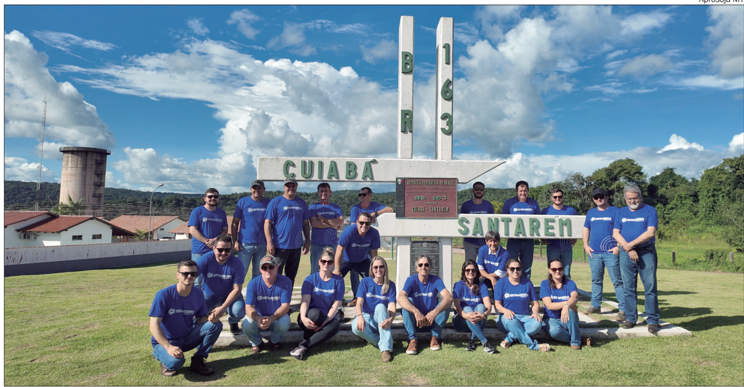
Pelo trajeto, são transportadas mais de 17 milhões de toneladas de soja de Mato Grosso para as Estações de Transbordo

Segundo Elisângela, a soja produzida no município com maior produção de soja de MT, Sorriso, que produz cerca de 2,2 milhões de toneladas da oleaginosa, exportada pela