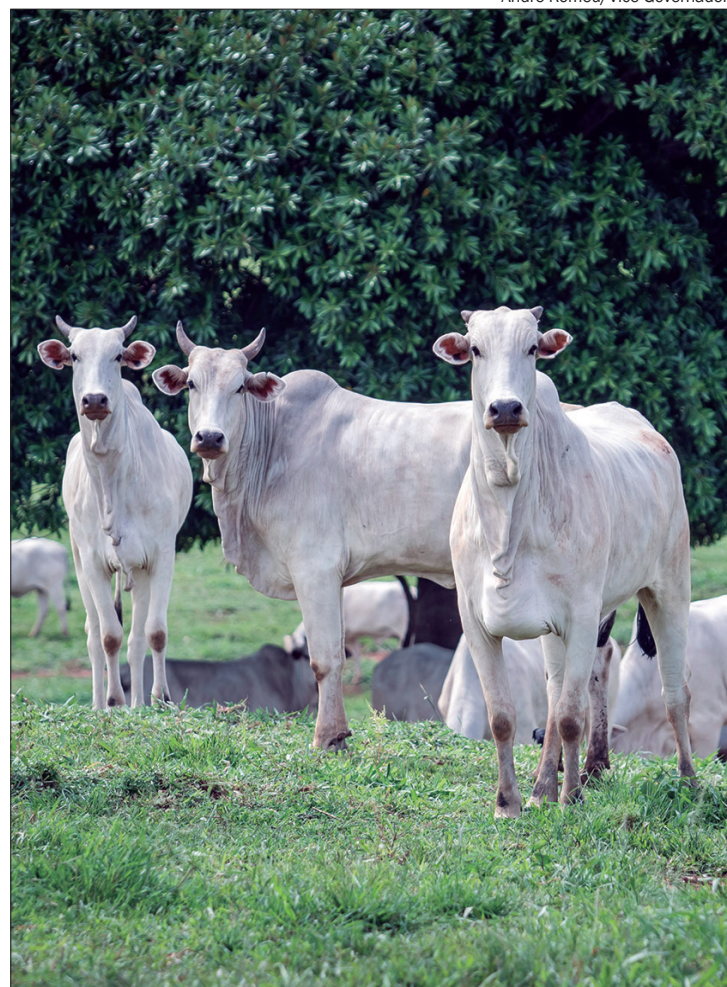
A meta é que o Brasil se torne totalmente livre de febre aftosa sem vacinação até 2026