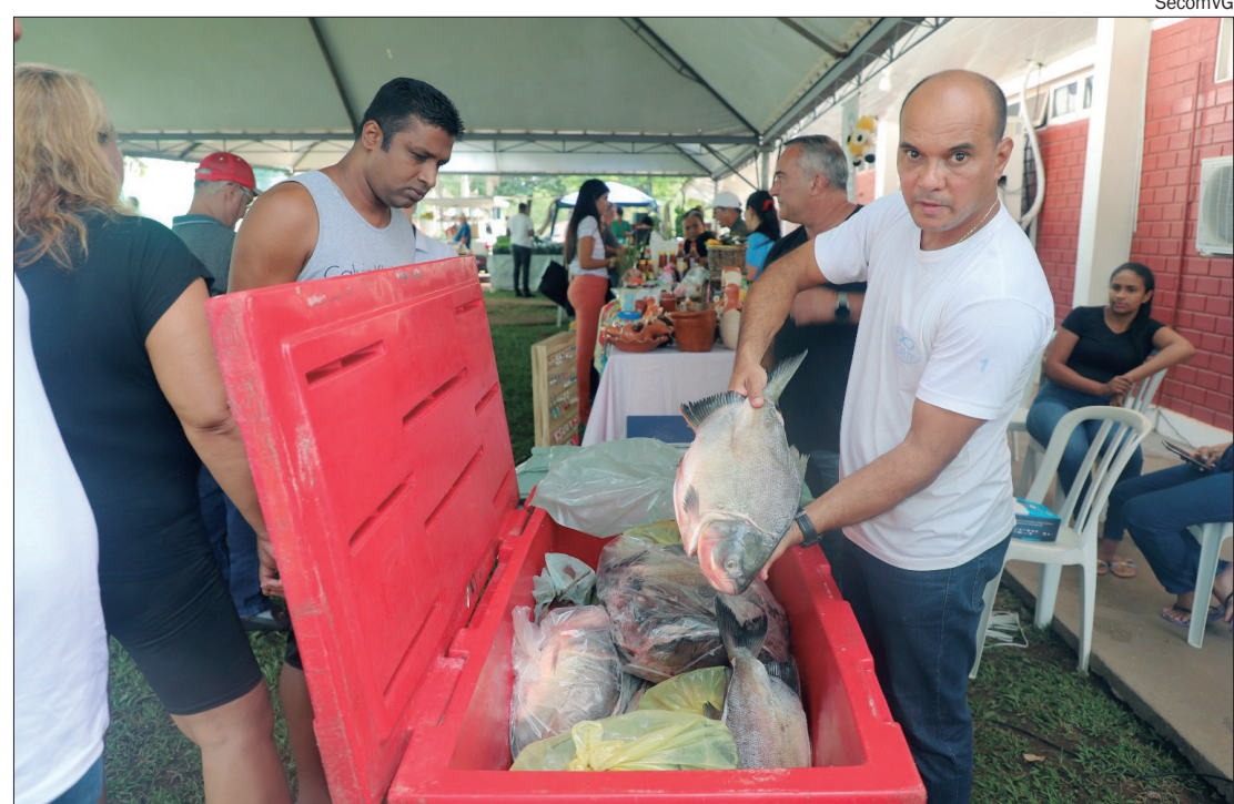
Durante os três dias, serão disponibilizadas 27 toneladas de pescados em nove locais da cidade, pelo valor de R$ 19,90

Além dos pontos de distribuição mencionados, o projeto implementa medidas de segurança sanitária