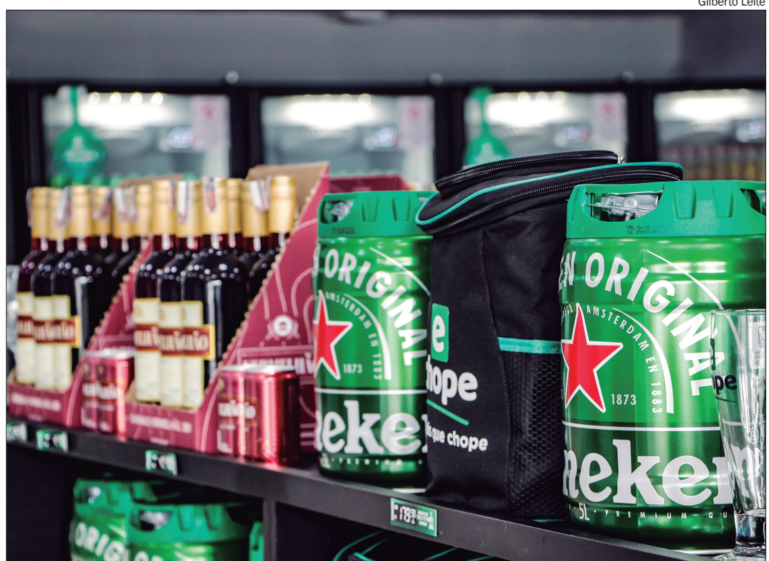
Para curtir a folia, é preciso pôr a mão no bolso, já que alguns itens ficaram mais caros este ano

Pesquise preços: Pesquise preços de alimentos, bebidas e outros itens antes de comprar.