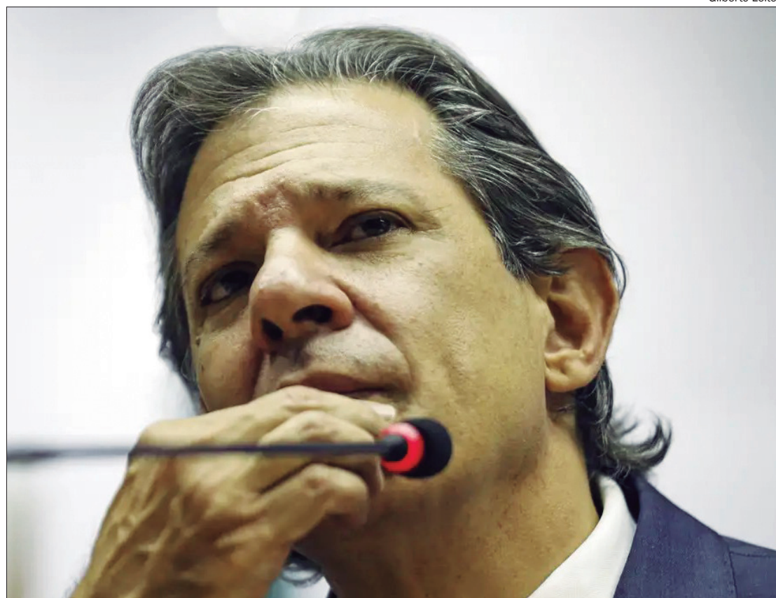
Haddad busca por um acordo sobre a MP que reonerará a folha de pagamentos

Na entrevista, o ministro disse que o objetivo da MP é permitir o crescimento do país com taxas de juros sustentáveis, argumentando que não pode prejudicar toda a sociedade com o custo da desoneração para dar vantagem a um setor específico.