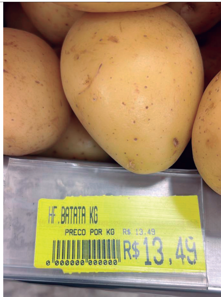
Preços de frutas, legumes e verduras dispararam devido ao aumento do frete e podem subir ainda mais

to porque as indústrias estão retornam ao trabalho entre 10 e 15 de janeiro. A partir de agora que teremos uma noção, no modo geral, de quanto vai subir na verdade.