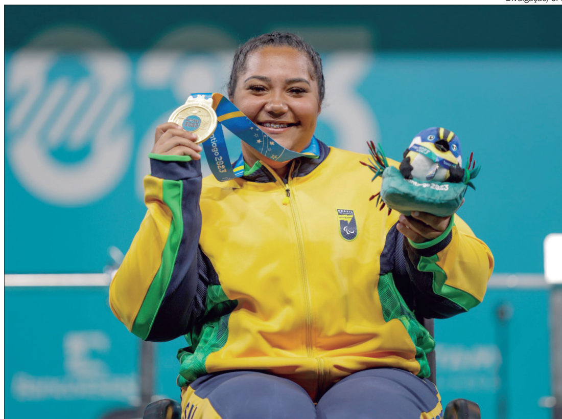
Delegação brasileira lidera o quadro de medalhas, com 55 ouros no Parapan de Santiago, no Chile

"Foi uma prova muito boa, fiz uma passagem boa, a volta pesei um pouquinho, mas deu para sustentar. Fiz o tempo que eu queria, estou muito feliz. Eu gosto muito de sentir essa pressão, desse calor aqui, porque ele [o