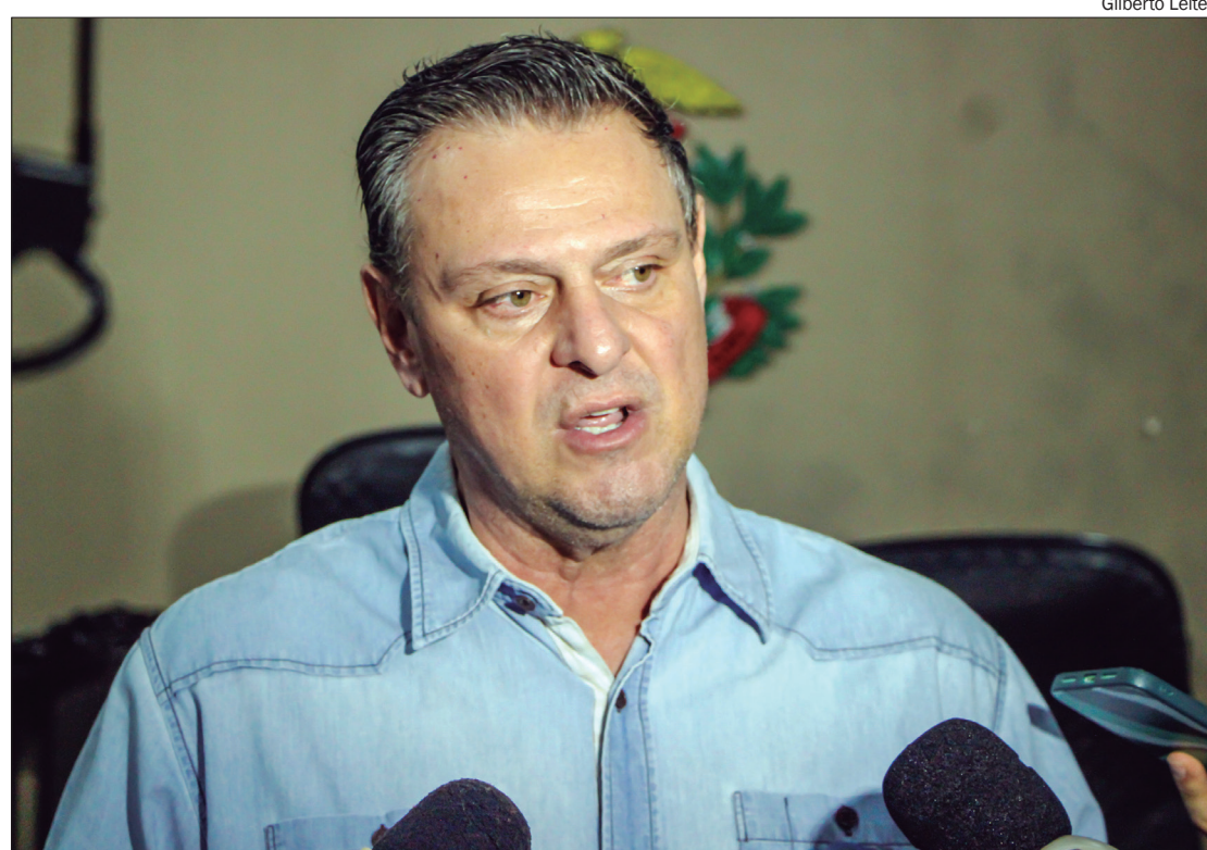
Para o ministro, a demanda não pode trazer insegurança para os produtores nem deixar de reconhecer os direitos da população indígena

“Eventual solução adotada pelo Poder Legislativo poderá ser esvaziada caso esta Suprema Corte prossiga com o julgamento deste tema da repercussão geral. Esse fato poderia, inclusive, ensejar nova apreciação da matéria pelo Poder Legislativo, o que somente aumentaria a indefinição sobre o tema e a insegurança jurídica a ela subjacente”, justificou.