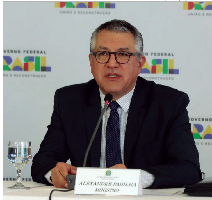
Repasse a estados e municípios estava previsto para 2024, mas será pago ainda este ano