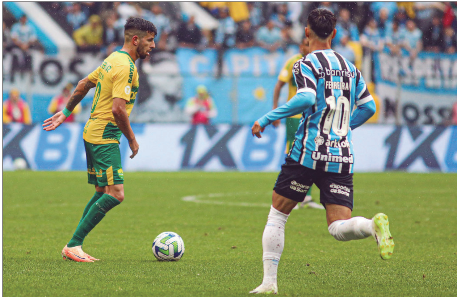
Cuiabá teve atuação apagada contra o Grêmio e sofreu com falhas pontuais de seu elenco