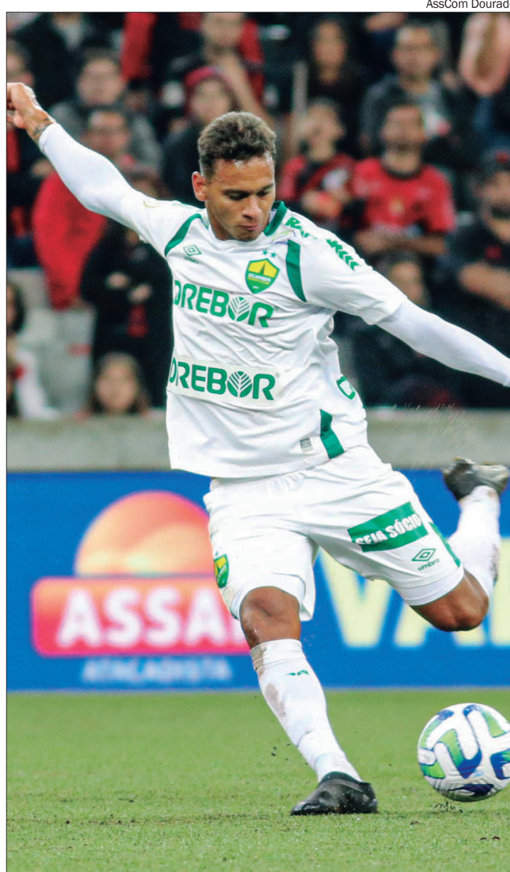
Cuiabá terá força total para enfrentar um Palmeiras recheado de desfalques

PALMEIRAS: Weverton; Marcos Rocha, Luan, Murilo e Piquerez; Zé Rafael, Richard Ríos e Jhon Jhon; Artur, Endrick e López. Técnico: Abel Ferreira