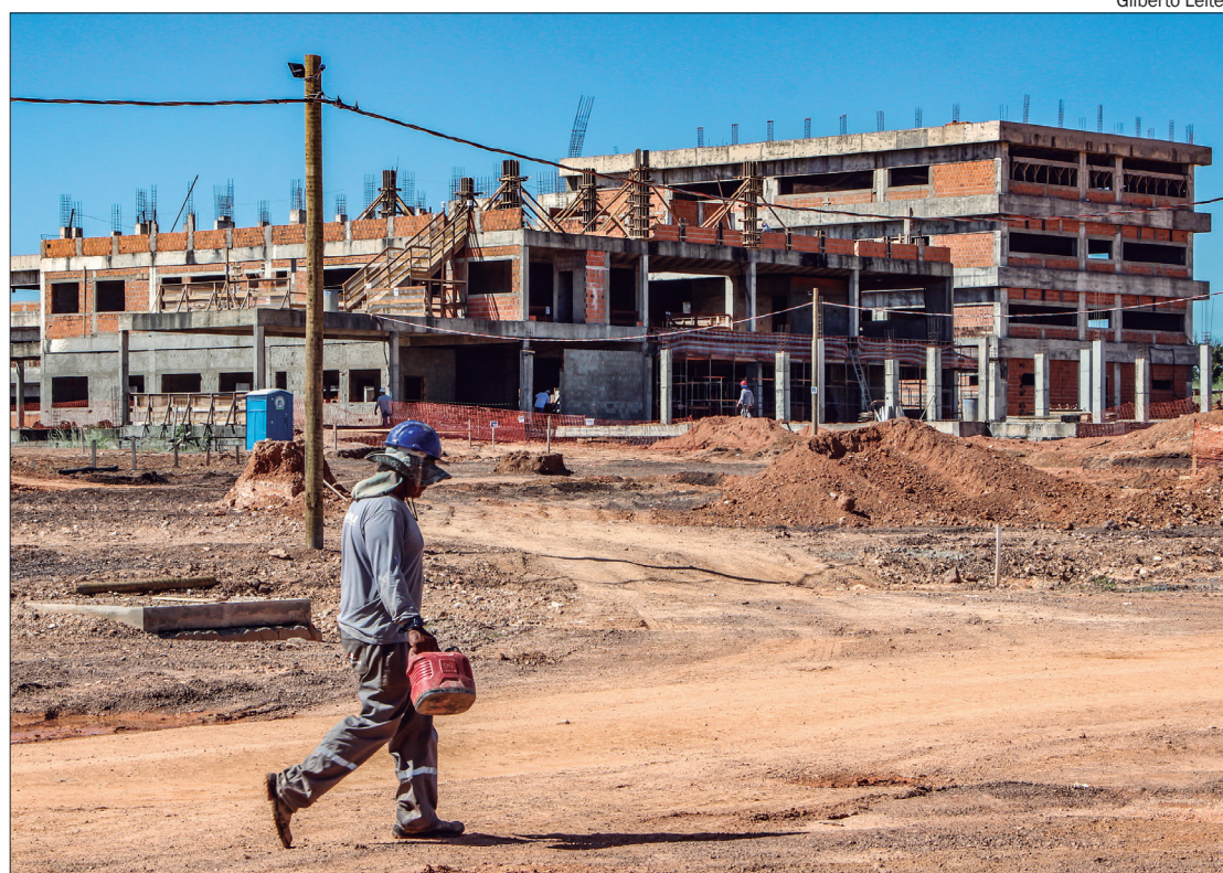
Construção civil foi um dos setores que mais gerou empregos, beneficiando-se das obras governamentais

Especialistas destacam que a gestão fiscal sólida de Mato Grosso e sua atratividade para investidores desempenham um papel