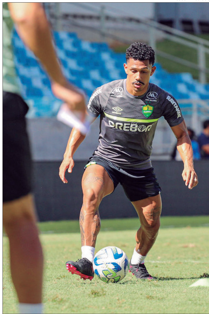
Cuiabá poderá contar com todo o elenco para o jogo contra o Bahia na Arena Pantanal