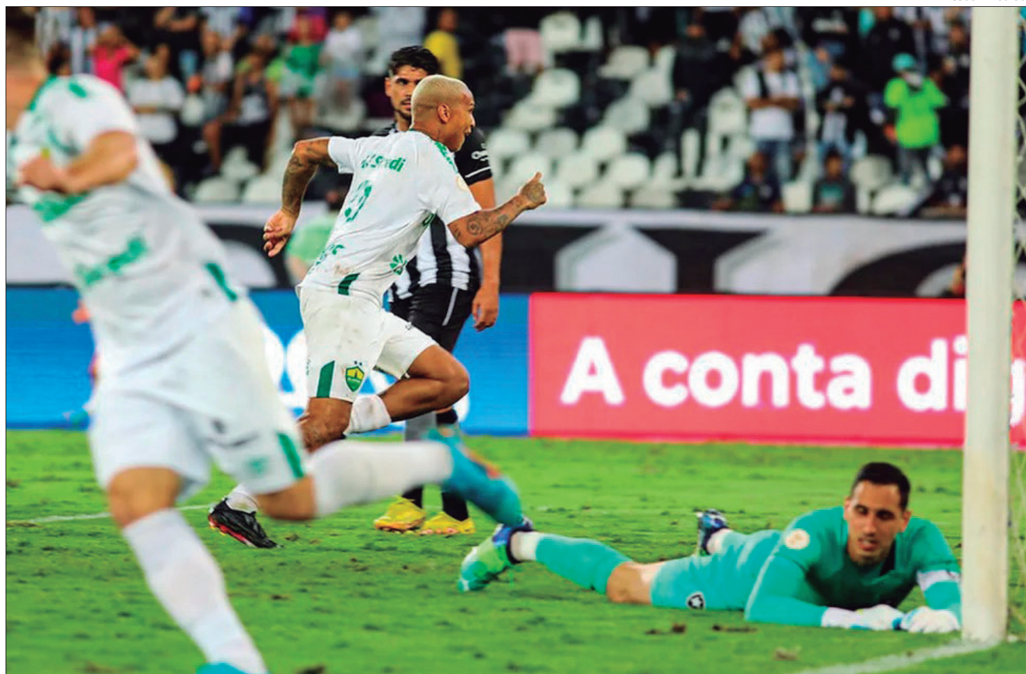
Cuiabá saiu vitorioso nas duas vezes em que enfrentou o Botafogo pelo Brasileirão, em 2022

O início do período invicto veio logo no ano seguinte e pela mesma competição. Desta vez, Cuiabá e Botafogo se enfrentaram pela primeira fase da Copa do Brasil, em dois jogos. Na par-