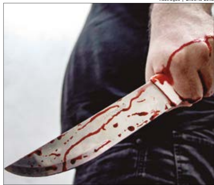
Ilustração | Gilberto Leite

Segundo a mulher, ela teria atacado o marido para se defender de agressões. A filha do casal foi encontrada chorando pelos policiais