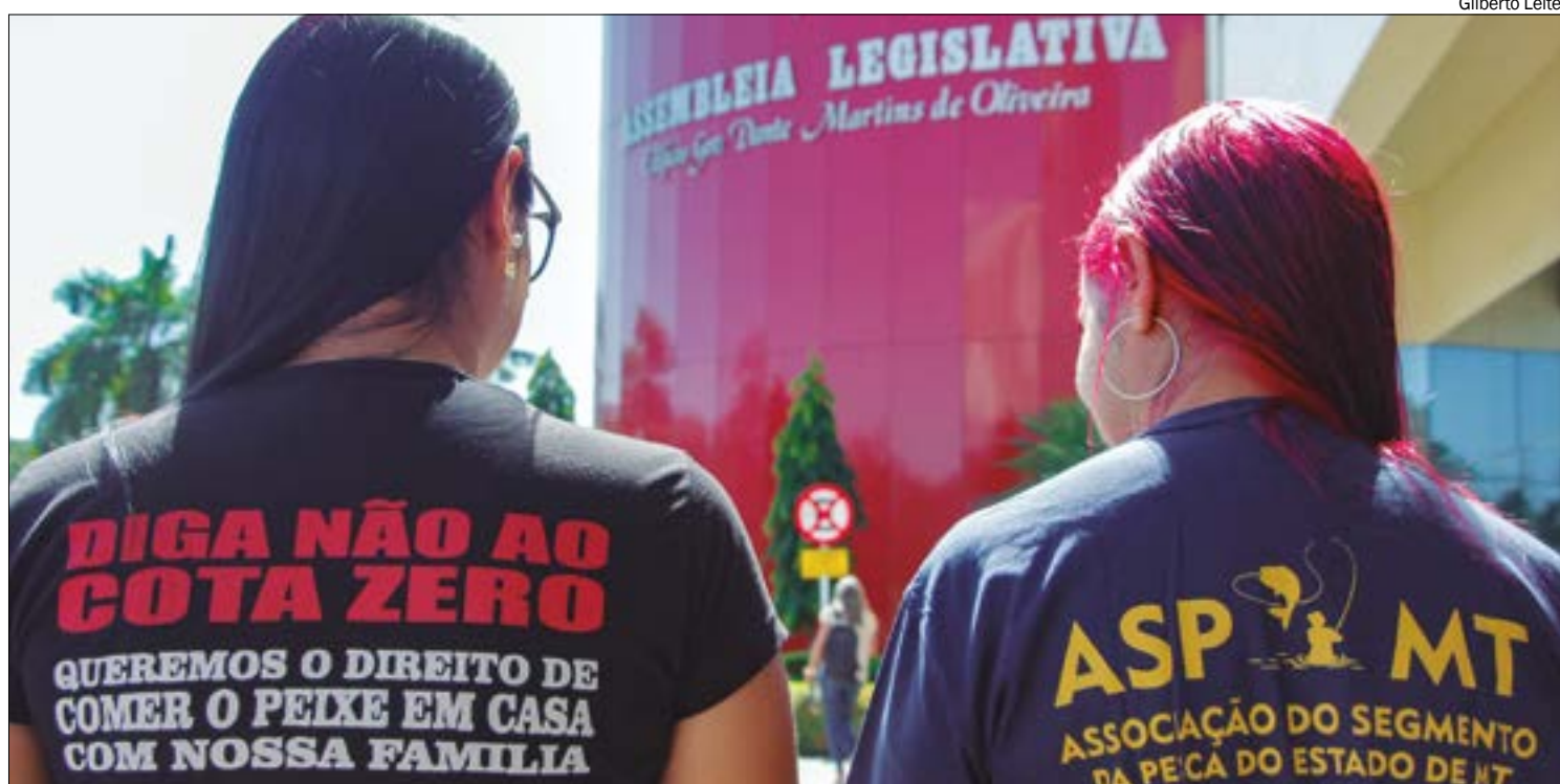
Pescadores se mobilizaram para pressionar os deputados, mas projeto foi aprovado em primeira votação

"É um risco que nós corremos aqui. Eu respeito os pescadores, tem um grupo de servidores da As-