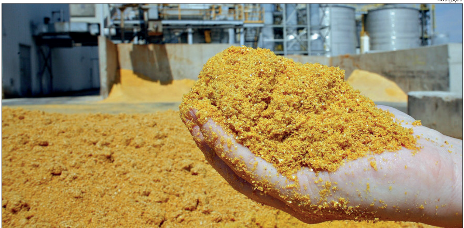
Com alto valor proteico, DDG tem sido usado como ração animal em grandes mercados, como nos EUA