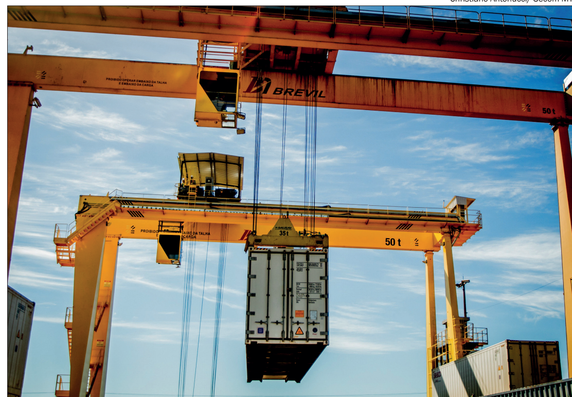
Christiano Antonucci/ Secom-MT

No setor agropecuário, o aumento do volume embarcado, provocado pela safra de grãos, principalmente pela segunda safra de milho, pesou mais nas exportações. O volume de mercadorias embarcadas avançou 35,9% em novembro na comparação com o