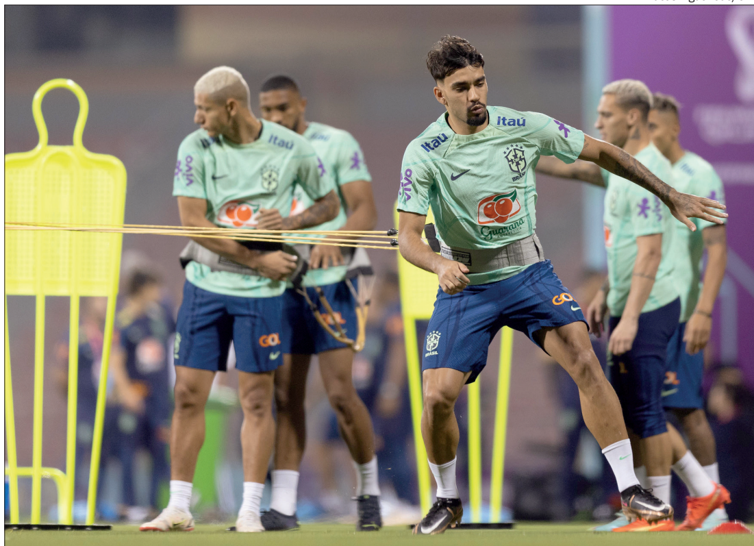
Tite trata escalação como 'segredo de Estado', mas adiantou que buscará equilíbrio no meio de campo