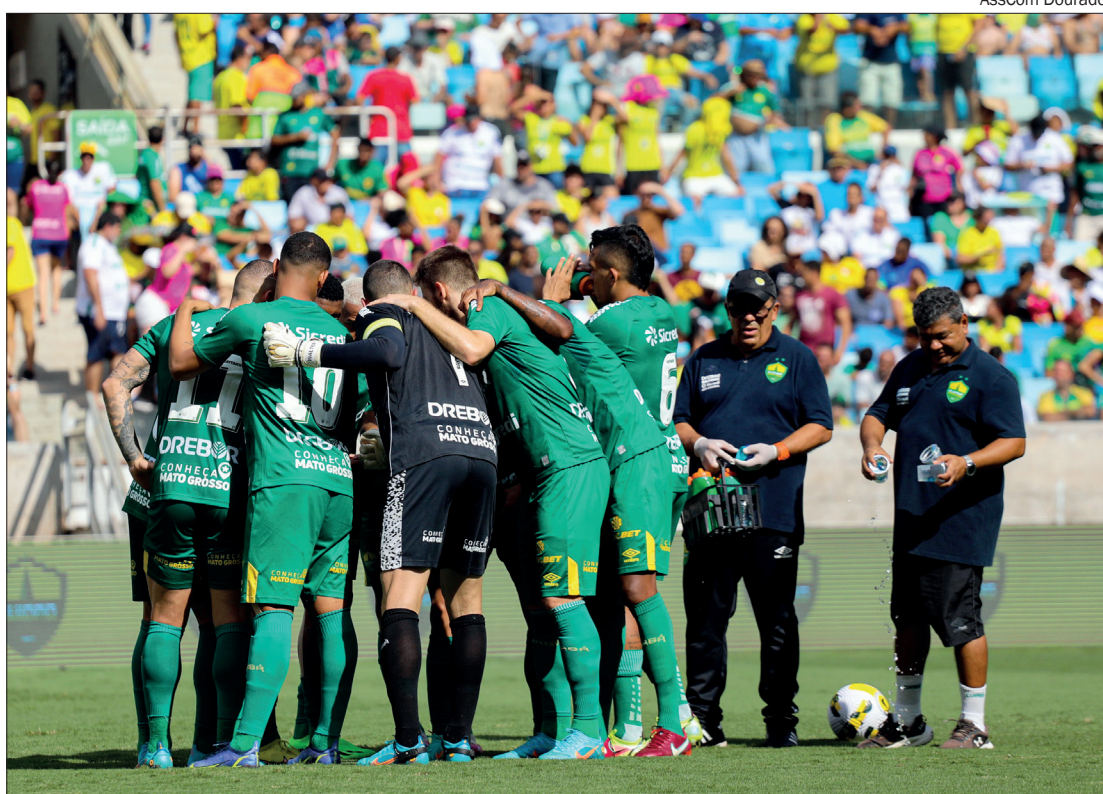
Alterações visam fortalecer o time para o Brasileiro 2023, que deve ser ainda mais difícil