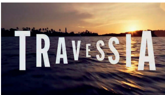
TRAVESSIA Globo - 21h15

Quinta-feira (17) - Tânia provoca Luísa, alegando que ela já superou Marcelo. Luísa se sente mal. Ela e Glória falam sobre o luto. Poliana não consegue dormir e lembra dos momentos com Eric. Luísa fala para Otto que encontrou Tânia no restaurante e ele fica preocupado. Poliana diz a Éric que ele podia estragar a amizade dela com Kessya. Bandidos invadem o CLL e roubam roupas para doação. Éric e Poliana têm uma conversa séria e ela deseja terminar. Na mansão de Otto, Roger visita Glória enquanto o irmão não está. Otto chega e fica furioso.