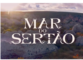
MAR DO SERTÃO Globo - 18h15

Os resumos dos capítulos de todas as novelas são de responsabilidade de cada emissora. Os capítulos que vão ao ar estão sujeitos a eventuais reedições