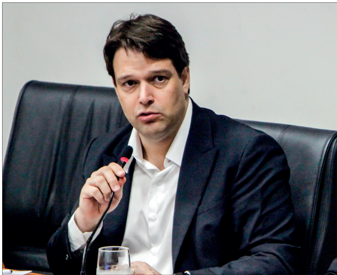
Para Gustavo, é primordial o fortalecimento dos programas e incentivos para produção de biocombustíveis

INDÚSTRIA NA COP - A CNI está na COP27 para apresentar a estratégia de sustentabilidade do setor industrial, compartilhar iniciativas do setor produtivo que buscam reduzir as