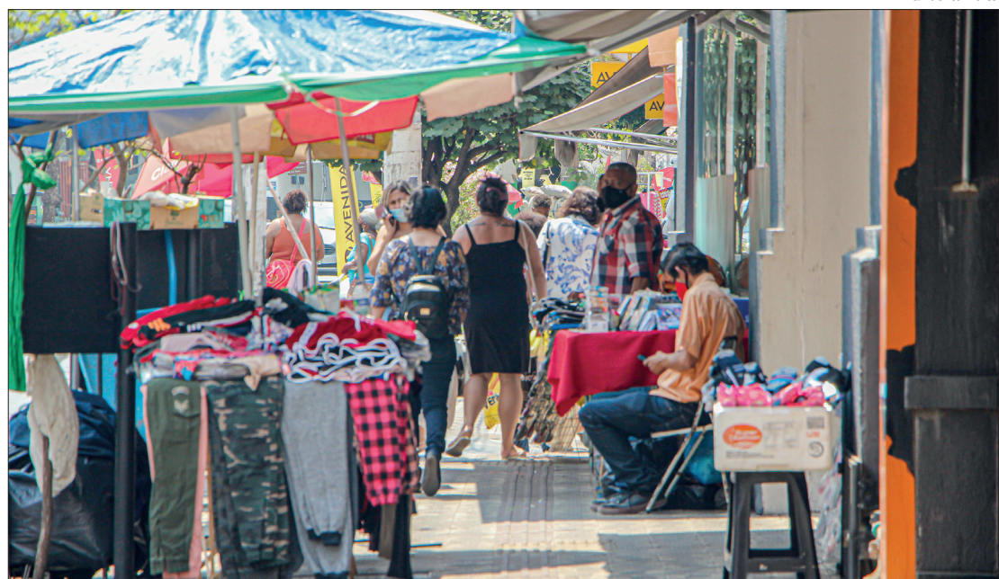
Convenção Coletiva firmou pagamento de hora extra em dobro, inclusive em comissão por venda