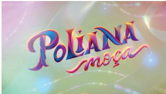
POLIANA MOÇA SBT - 20h30

Quinta-feira (17) - Pat repreende Rebeca e exige que ela deponha contra Danilo. Femanda não aceita ajudar Danilo a falar com Rebeca. Pat vai embora e Rebeca relembra tudo o que descobriu sobre o marido. Duarte avisa Jéssica que deixará o país. Danilo invade o apartamento de Moa para falar com Rebeca. Armandinho se solidariza com Pat. Renan fala com Anita e descobre que Jéssica mentiu para ele. Gustavo encontra com Duarte/Bob e não o deixa ir embora. Alfredo consola Pat. Hugo desaprova a ideia de André de ajudar Moa. Leonardo pensa em romper com Danilo. Renan termina o namoro com Jéssica. Margaret, Dalva e Cleide decidem armar para enganar Armandinho. Ítalo encontra os falsos contratos assinados por Bob Wright. Moa tem alta do hospital e pensa em ir para a casa de Andréa.