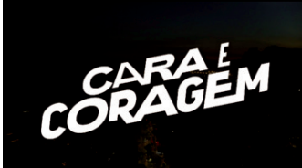
CARA E CORAGEM Globo - 19h15

Quinta-feira (17) - Ismênia estranha ao ver o calmante de Deodora. Firmino consegue vencer a partida contra Vaniclei. Vespertino se surpreende com a presença de Pajeú em seu quarto. Deodora culpa Candoca pela piora no estado do Coronel, e a médica fica intrigada. Pajeú leva Vespertino para José, que insiste que ele se entregue à polícia. Laura entrega uma documentação para Tertulino que pode prejudicar José. Tertulino exige que Floro Boromeu liberte Vespertino. Deodora dopa o Coronel. Latifa pede a ajuda de Timbó para atralhar o duelo entre Zahym e Maruan. Zaym atira contra Maruan, e Labibe se declara para o príncipe. Tertulino questiona Candoca sobre seus sentimentos por ele. José encontra as promissórias de Tertulino no cofre de Vespertino.