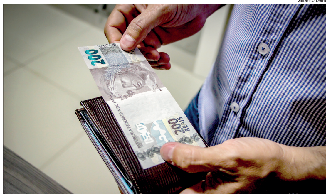
Maior impacto ocorreu com novas informações sobre setor de serviços

nos benefícios sociais recebidas pelas famílias também na comparação com 2019.