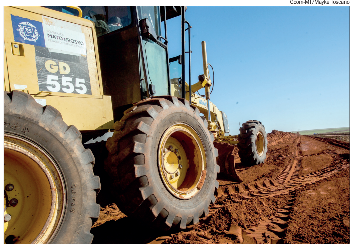
O investimento previsto pelo Governo de Mato Grosso é de R$ 31.453.482,42, para a realização desta obra

Outras licitações em andamento na Sinfra são: para construção de uma ponte sobre o Rio Von Den Steinen, na MT-140/324, em Nova Uiratã, um investimento de R$ 3,9 milhões; e para melhoria funcional de 99,7 km da MT-020, em Paranatinga.