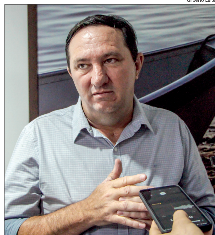
Barranco diz que Orçamento de 2023 é 'peça fictícia' e promete atraparalhar tramitação

O cumprimento destas emendas, por vezes, é alvo de reclamação de parlamentares, principalmente daqueles que compõem a