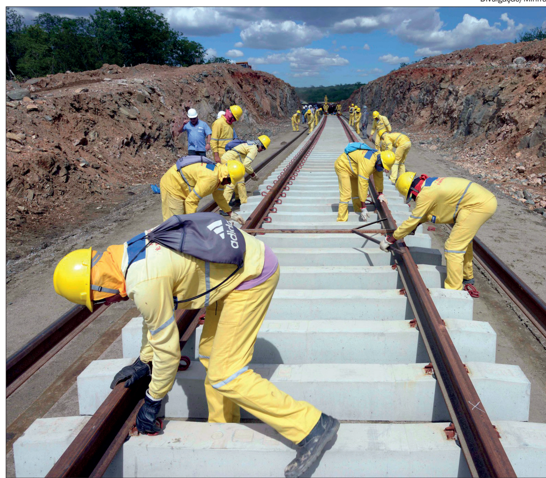
Autorizações preveem investimentos de R$ 11,3 bilhões na construção de dois ramais de ferrovia em MT

Os investimentos previstos nos dois novos projetos da Rumo estão avaliados em R$ 11,3 bilhões, sendo R$ 3,8 bilhões no trecho entre Santa Rita do Trivelato e Sinop e outros R$ 7,5 bilhões no ramal entre Primavera e Ribeirão. Atualmente, Mato Grosso possui apenas uma ferrovia em operação, que é a Ferrovia Norte-Sul, que chega até Rondonópolis e é controlada pela Rumo S.A.