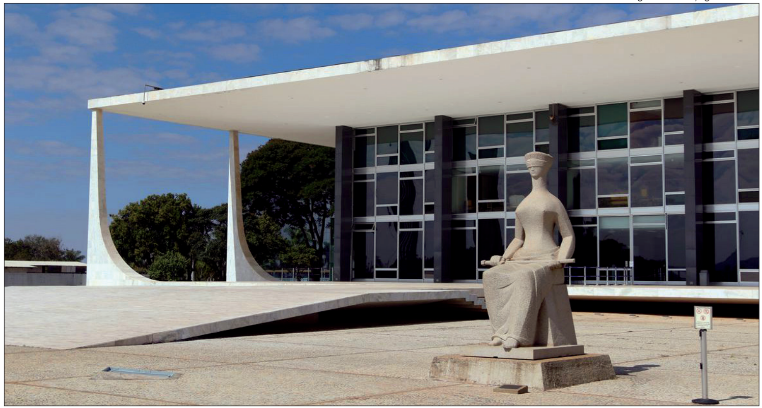
Governo deve agora deixar de arrecadar R$ 1,05 bilhão por ano com decisão do STF

Por esse motivo, não seria possível impedir as cobranças indevidas feitas no passado pela Receita Federal, pois fazer isso seria ferir a dignidade da pessoa