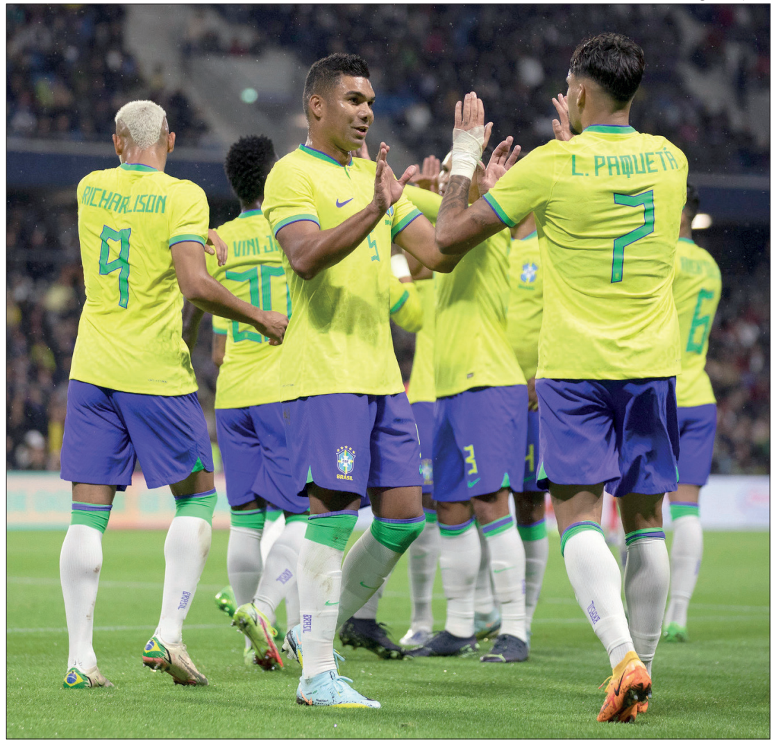
Recheada de talentos, seleção de Tite tem apresentado um futebol consistente nos jogos que precedem a Copa

seus adversários com propriedade dentro de campo, com maior controle, posse de bola e número de finalizações. A seleção canarinho deposita sua esperança em craques como Neymar, Vinicius Júnior e Raphinha, que têm desempenhado bem tanto nos clubes que jogam quanto com a camisa amarelinha.