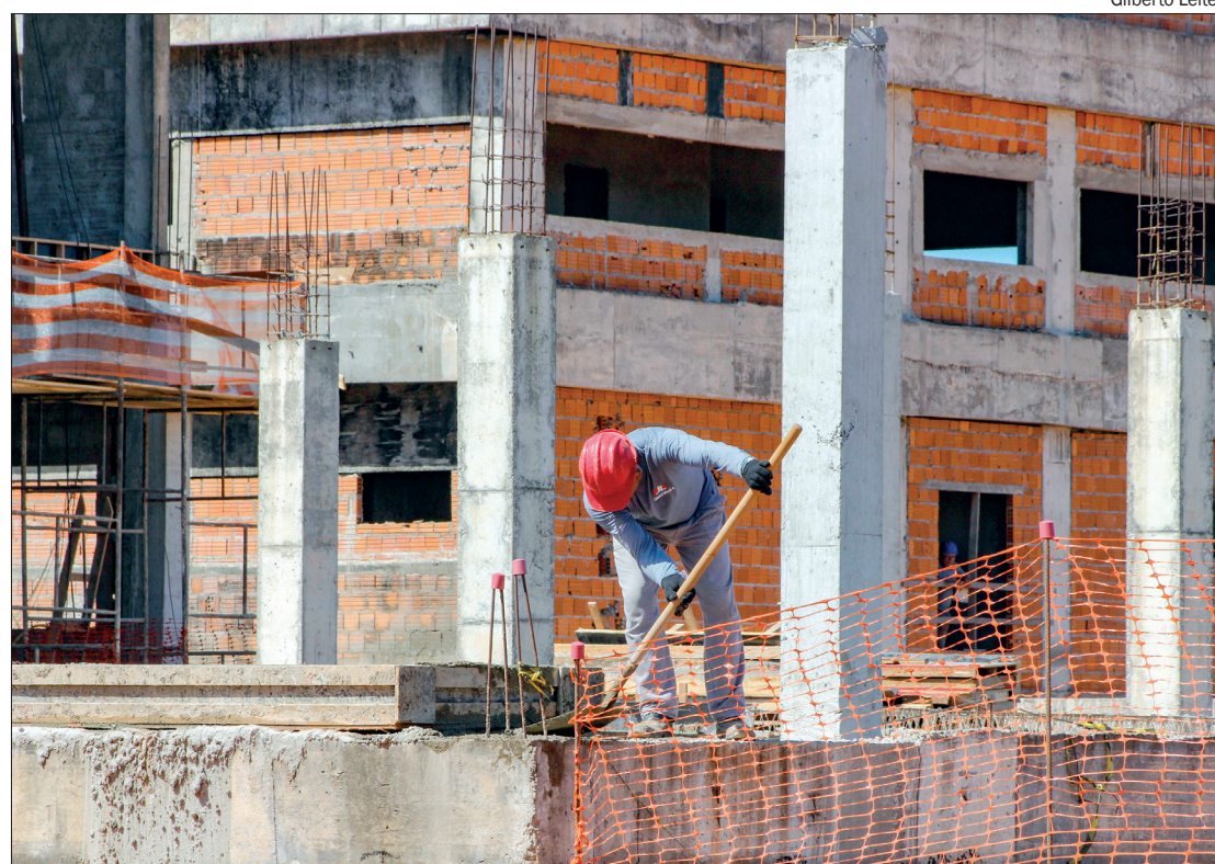
Ranking de competitividade é uma ferramenta importante na decisão de investimento de grandes empresas