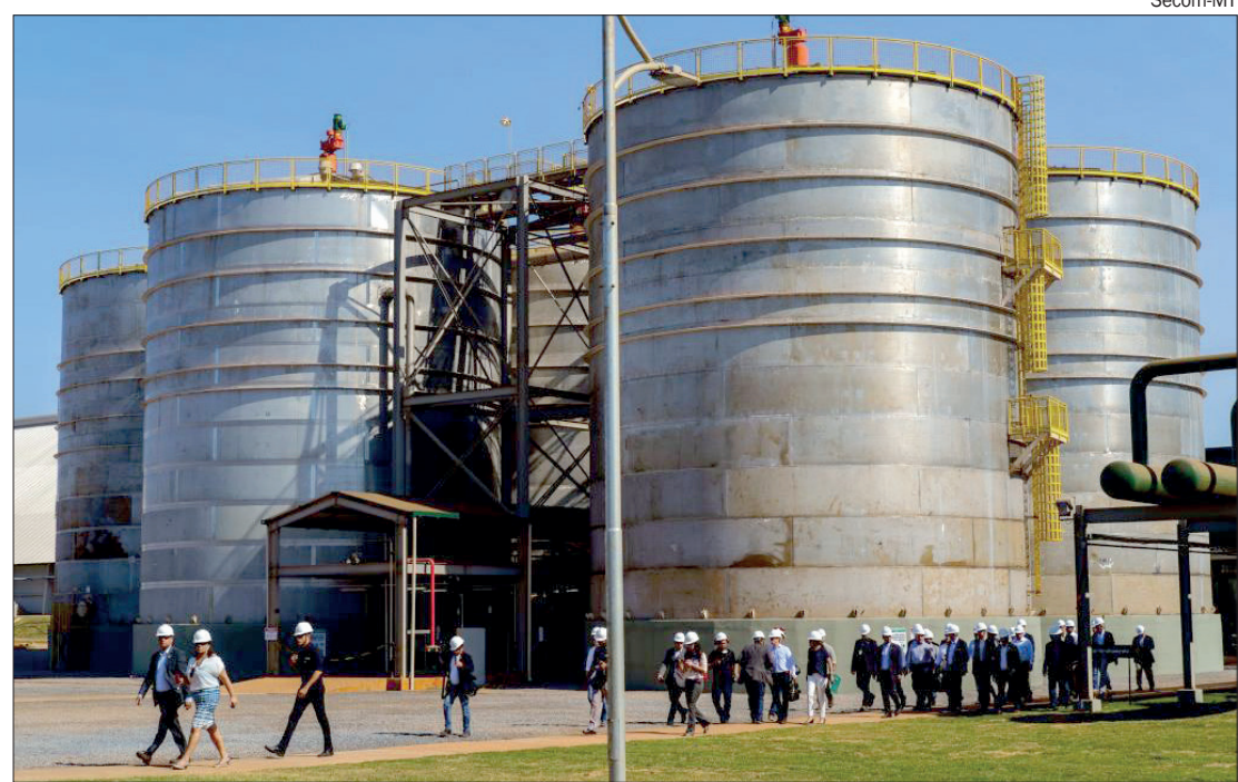
Agroindústria responde por 40% dos empregos gerados pelo agronegócio em MT

as áreas Transversais (33.248), Metalomecânica (32.654) e Logística e Transporte (28.123).