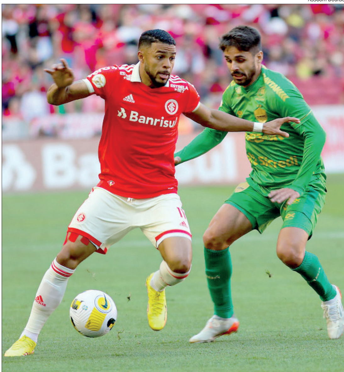
Cuiabá jogou mal e terminou a partida com apenas uma finalização, contra 16 do Internacional

Porém, nem só de polêmica ‘viveu’ o jogo. A equi-