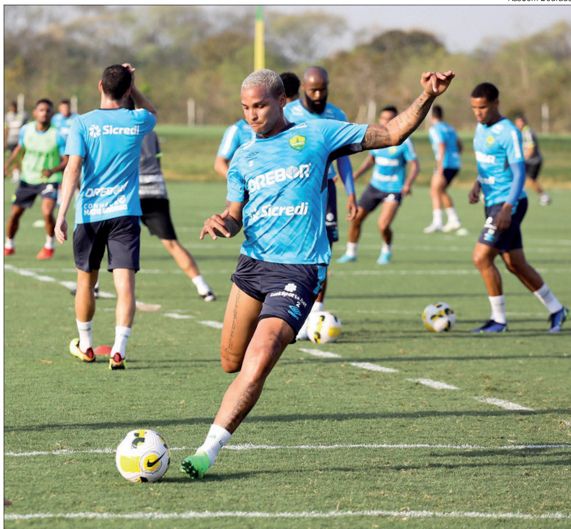
Sem perder há três jogos, Cuiabá tenta conquistar a primeira vitória contra o São Paulo em sua história

*Estagiário sob supervisão do editor Gabriel Soares