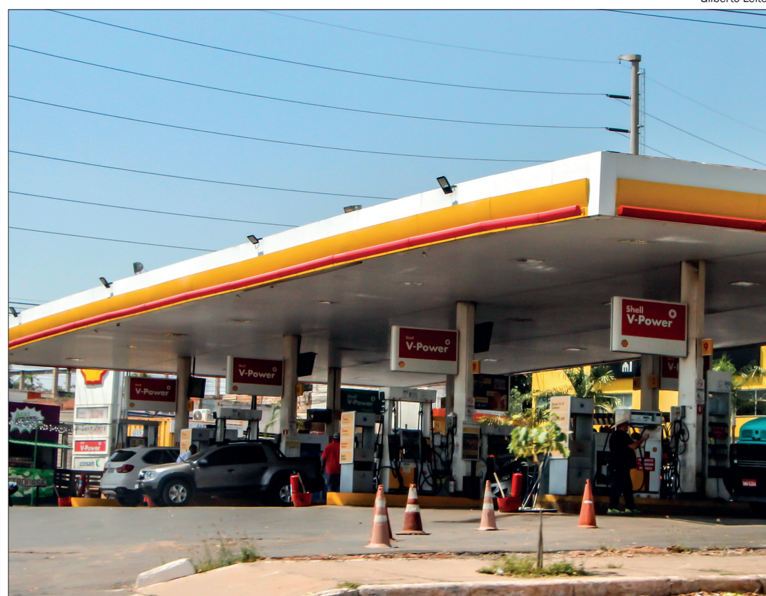
Preço da gasolina segue estável, mas diesel sofre aumento de demanda na Europa e tem tendência de valorização

GASOLINA E ETANOL -Já os demais combustíveis, como o etanol e a