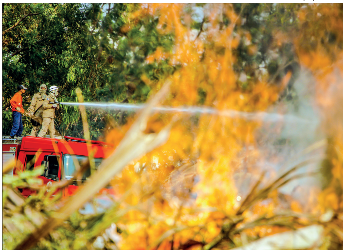
Cerca de 50 homens do Corpo de Bombeiros trabalham para conter as chamas que se alastram pela vegetação

De acordo com o Clima Tempo, os próximos 15