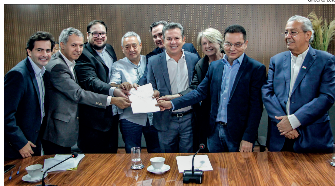
Após ordem de serviço, empreiteira ainda precisa apresentar projetos e cronograma de intervenções para o BRT

A assinatura do contrato ocorre no primeiro dia útil após o ministro Dias Toffoli, do Supremo Tribunal Federal (STF), devolver ao Tribunal de Contas do Estado (TCE-MT) a competência fiscalizatória sobre