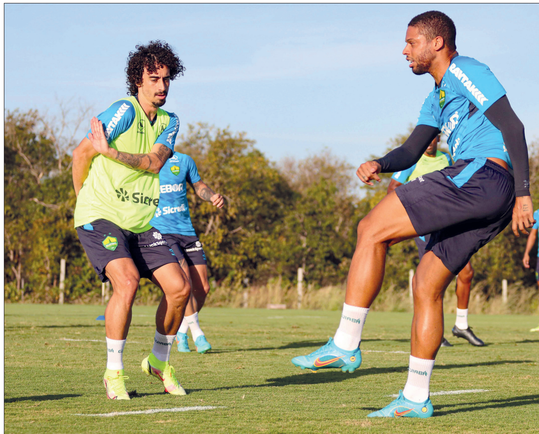
Cuiabá vem de uma série de duas vitórias e teve mais uma semana cheia para treinar, mas tem dúvidas na escalação

"Quem estiver em campo precisa agarrar a oportunidade e quem vier de fora precisa fazer o mesmo. O objetivo é ajudar o Cuiabá, independentemente de quem jogue", disse.