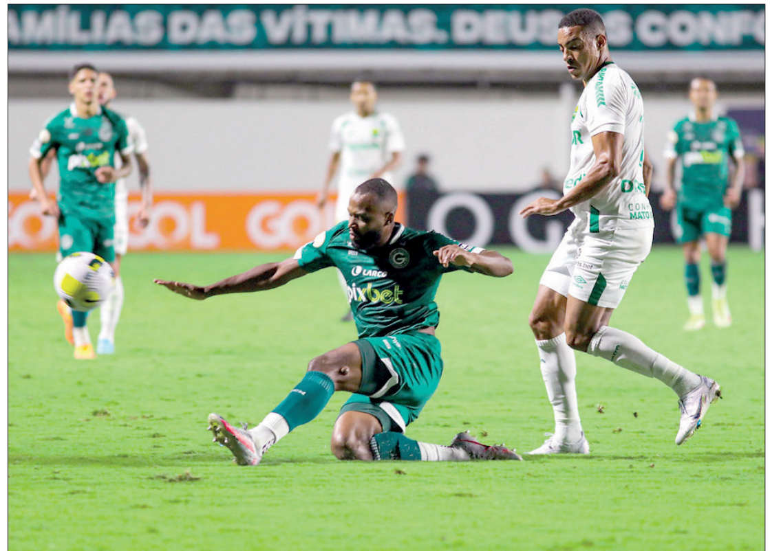
Cuiabá conseguiu controlar o Goiás e criar chances de gol, mas acabou perdendo em um momento de descuido

Aliás, há muitos paralelos a serem feitos. Esse exemplo do passado é um fio de esperança ao qual a comissão técnica atual se agarra, na certeza de que conseguirá reverter a situação com muito trabalho no Centro de Treinamento.