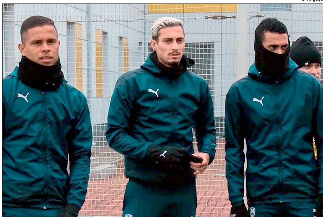
Jogadores que atuam na Ucrânia pedem ajuda das autoridades para deixar o país e retornar ao Brasil

Informações locais apontam que os clubes ucranianos não esperavam o ataque, ou até esperavam, mas consideravam que aconteceria apenas na região de fronteira. Por isso, eles ainda não se posicionaram quanto à situação de seus atletas estrangeiros, que estão com famílias