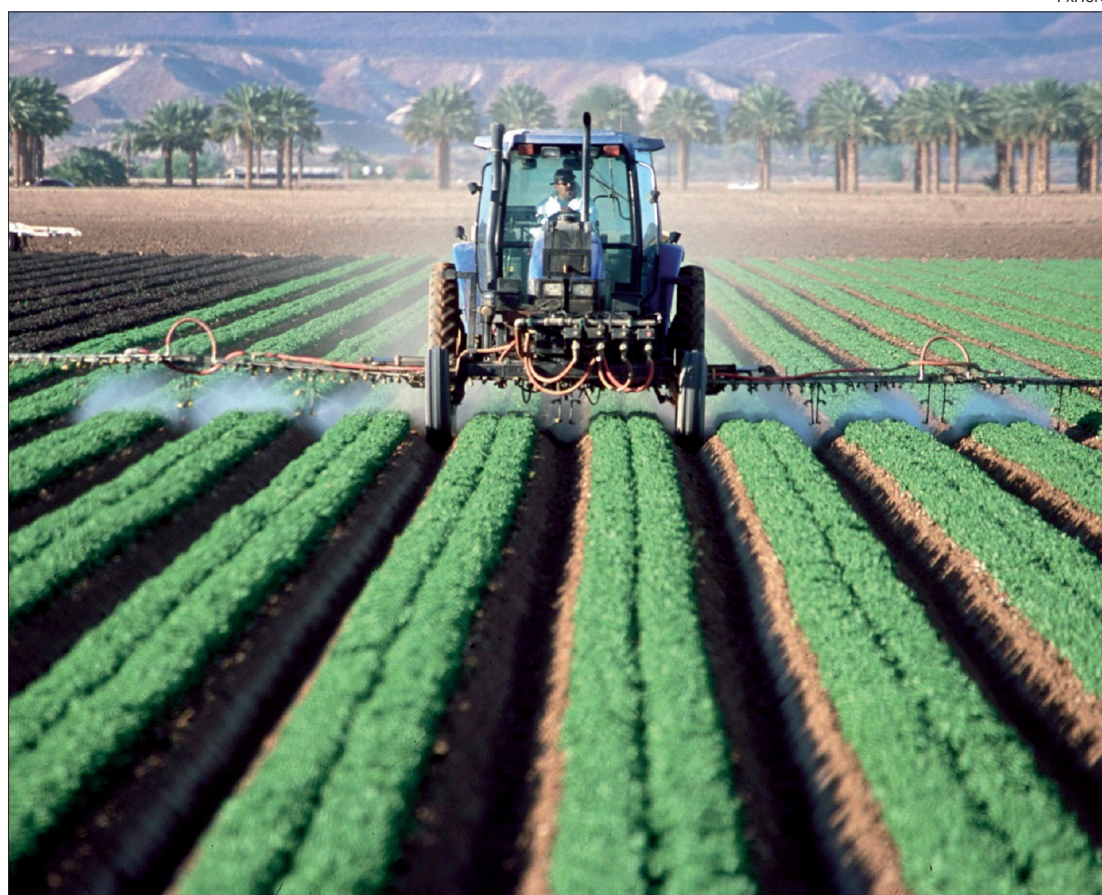
Aprosoja cobra explicações da Bayer sobre problemas no fornecimento de glifosato, herbicida mais usado no Brasil

A Associação dos Produtores de Soja e Milho de Mato Grosso (Aprosoja/MT) emitiu nota criticando a falta de explicações convincentes da empresa, que alegou apenas 'situação de força maior' e que estabeleceu prazo de três meses para resolver o problema, prazo considerado muito longo, devido ao risco de prejuízo às lavouras.