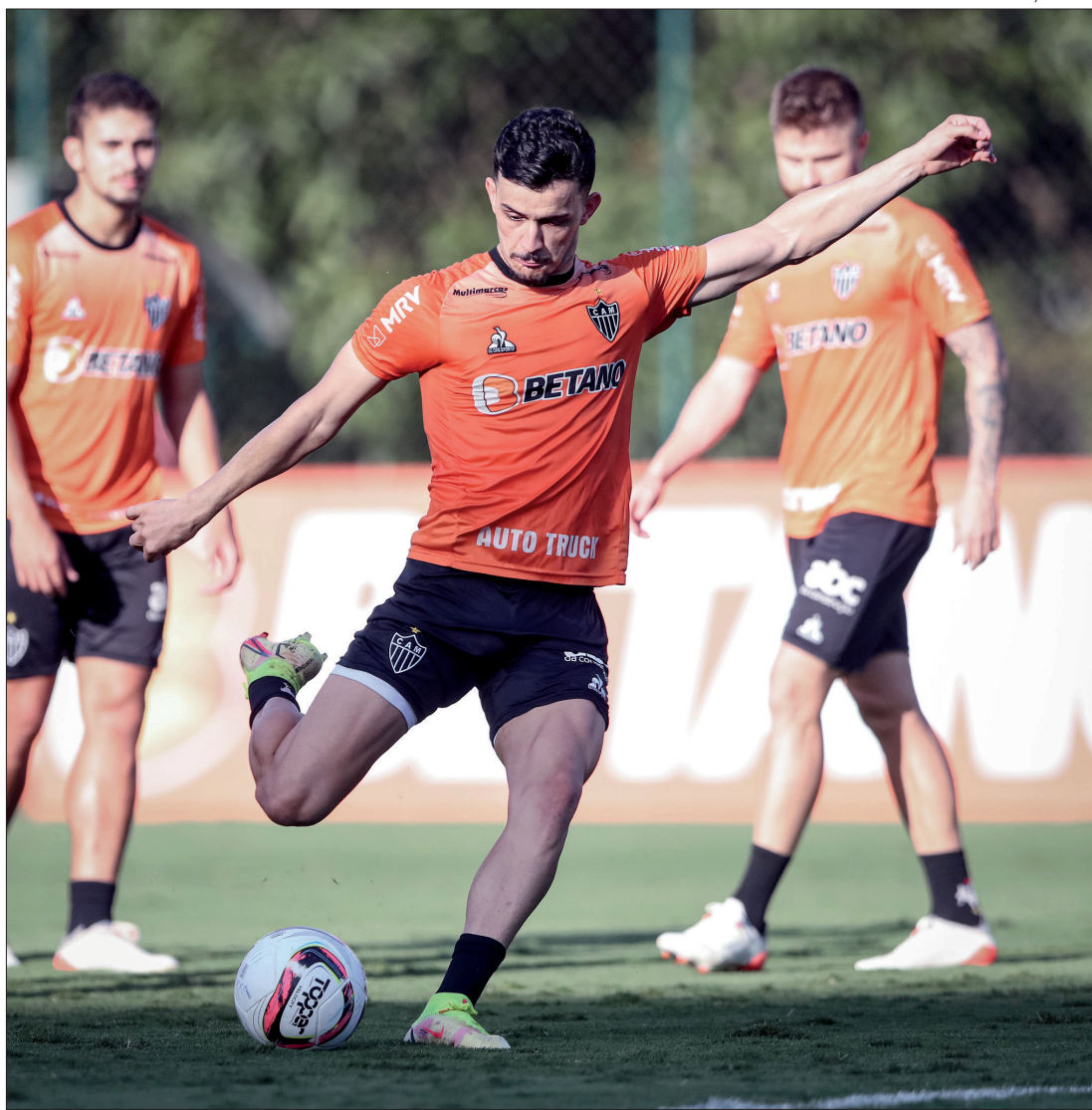
Atlético-MG e Flamengo foram autorizados a chegarem em Cuiabá só na véspera da partida

Após o Atlético notificar que só viria a Cuiabá na véspera do jogo, o Flamengo alegou falta de isonomia na decisão e também pediu o mesmo 'benefício'. O clube carioca já tinha reservado vagas em um dos melhores hotéis da cidade e havia programado sua logística para desembarcar na capital nesta quinta-feira (17). Também havia reservado horários para